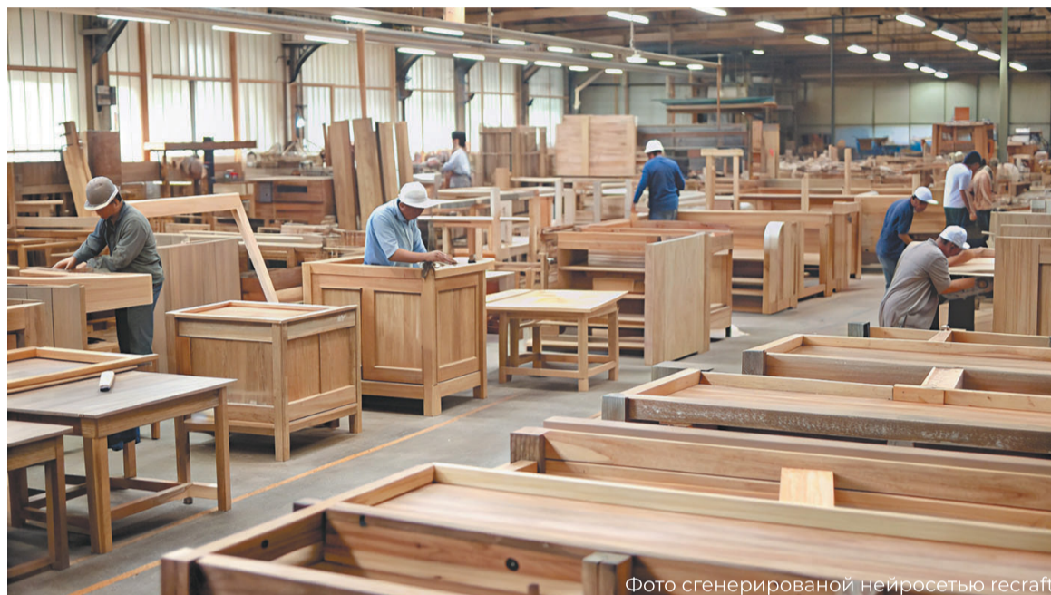
Фото сгенерированной нейросетью recraft.