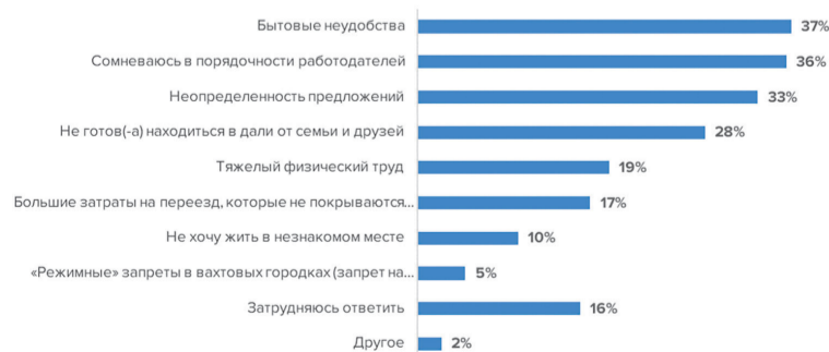
Что вас отталкивает от вахтового метода работы? Кировская область, 2023г

обстоятельствах и если вообще не будет работы в регионе, где живут. С другой стороны, 31% жителей