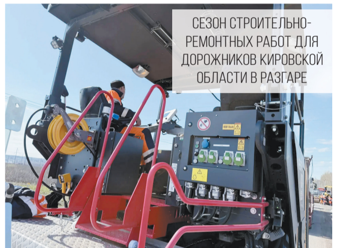
СЕЗОН СТРОИТЕЛЬНО-РЕМОНТНЫХ РАБОТ ДЛЯ ДОРОЖНИКОВ КИРОВСКОЙ ОБЛАСТИ В РАЗГАРЕ