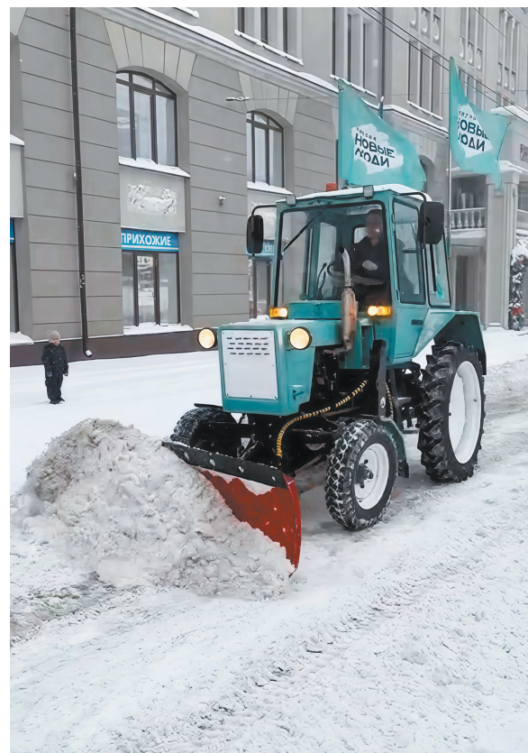
Трактор от «Новых людей» в праздники помогал расчищать остановки и парковки города.

Региональное отделение партии «Новые люди» в Кировской области.