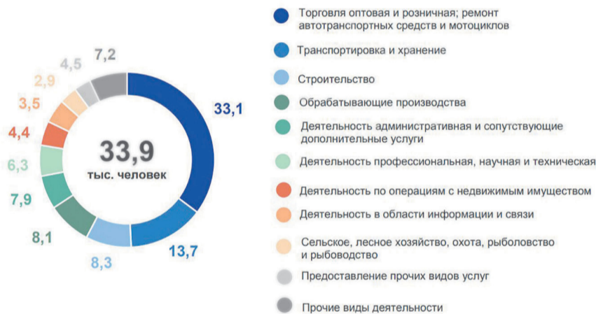
Распределение индивидуальных предпринимателей Кировской области по видам экономической деятельности на 01.01.2026, в процентах к итогу

«На начало 2026 года среди индивидуальных предпринимателей региона – 144 иностранных гражданина. Значительная часть из них представители Узбекистана (26%), Азербайджана (19%) и Вьетнама (13%)», – добавили в ведомстве.